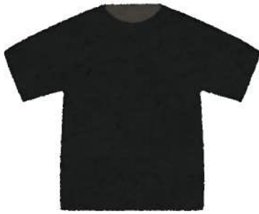
薄手無地のTシャツ1枚 (色付き可)